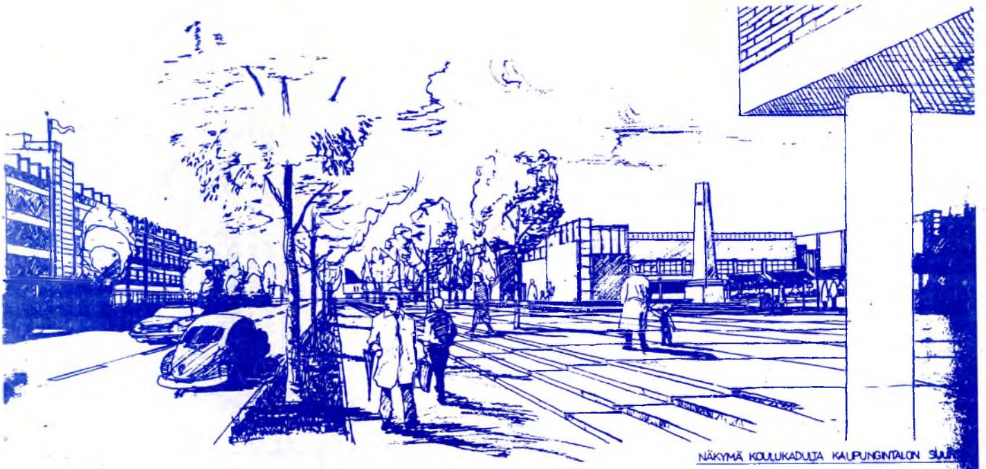
NÄKYMÄ KOULUKADULTA KAUPUNGINTALON SUUNTAAN

Seinäjoen kaupungista uhkaa kehittyä ultramoderni menestyvien ihmisten kaupunki. Koulukatukin on muuttumassa huolettomasti käyskelevien knallipäitien ja limusiineissaan huristelevien businessmiesten bulevardiksi. Mutta kun taustalla hämmöttävän kaupungintalon eteen pystytetään patsas epäonnistuneille, muuttuu kaupungin ilme heti paljon inhimillisemmäksi. Aaltocenterin arkkitehtuuriin tutustuvat turistitkin saavat viivähtää tuokion patsaan juurella.